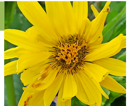
La fleur de Silphie

Semblable aux tournesols avec sa couleur jaune flamboyante et sa taille, la Silphie s'implante en Europe pour des raisons écologiques. C'est sur la commune de Férin qu'elle fleurit aujourd'hui après 2 ans de culture.