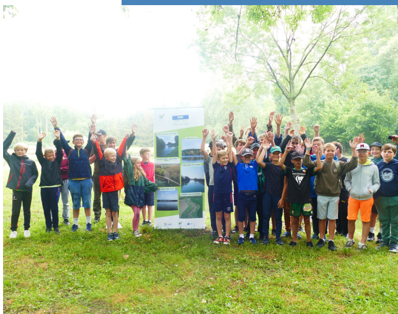
Les jeunes de l'Arleusienne